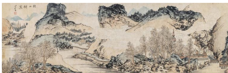
Lot 104 溥儒 《秋山斜照》 成交價 HK$ 684,400