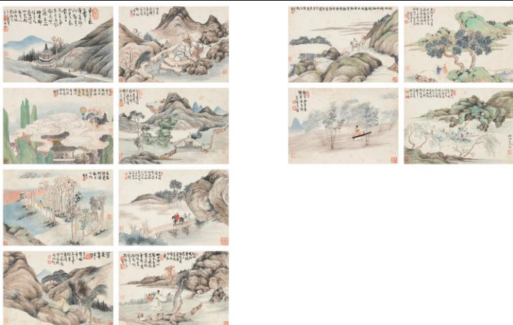
Lot 7 任預、陳半丁題 《前人詩意冊》 成交價 HK$ 224,200