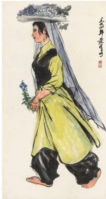
Lot 105 黃胄 《豐收圖》 成交價 HK$ 448,400