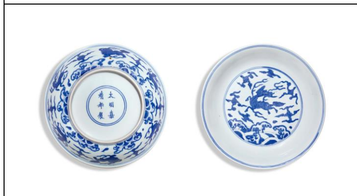
Lot 230 明嘉靖 青花瑞獸紋盤 成交價 HK$ 141,600