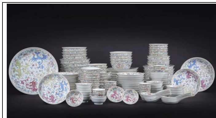
Lot 181-195 清光緒 粉彩夔鳳紋餐具一組 成交價 HK$ 888,540