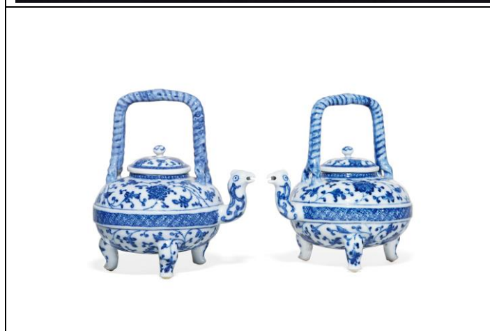
Lot 210 清乾隆 青花鳳首提梁壺一對 成交價 HK$ 259,600