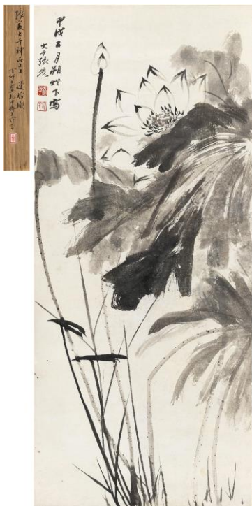
Lot 103 張大千 《蓮塘圖》 成交價 HK$ 1,038,400